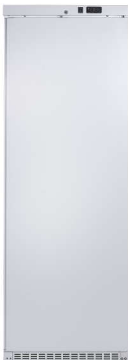
MAC460 PO BL