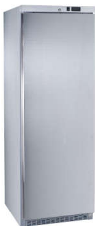
MAC460 PO A